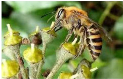
Collette du lierre